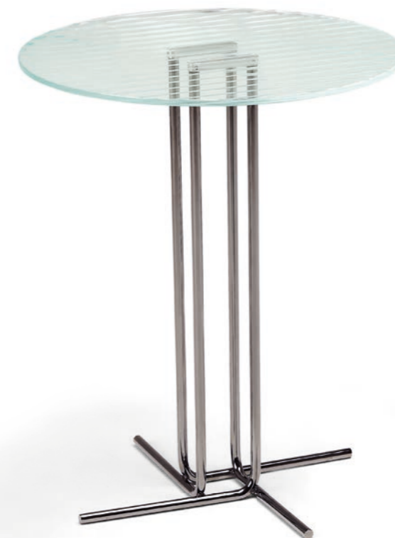
Small table • Odissey : black nickel base.

Il piano in vetro, inciso con tecnologia laser, regala armonia allo spazio, mentre il gioco di contrasti con le forme geometriche e le gambe sottili e raffinate ne sanciscono la cifra stilistica tipica delle collezioni di Arketipo.