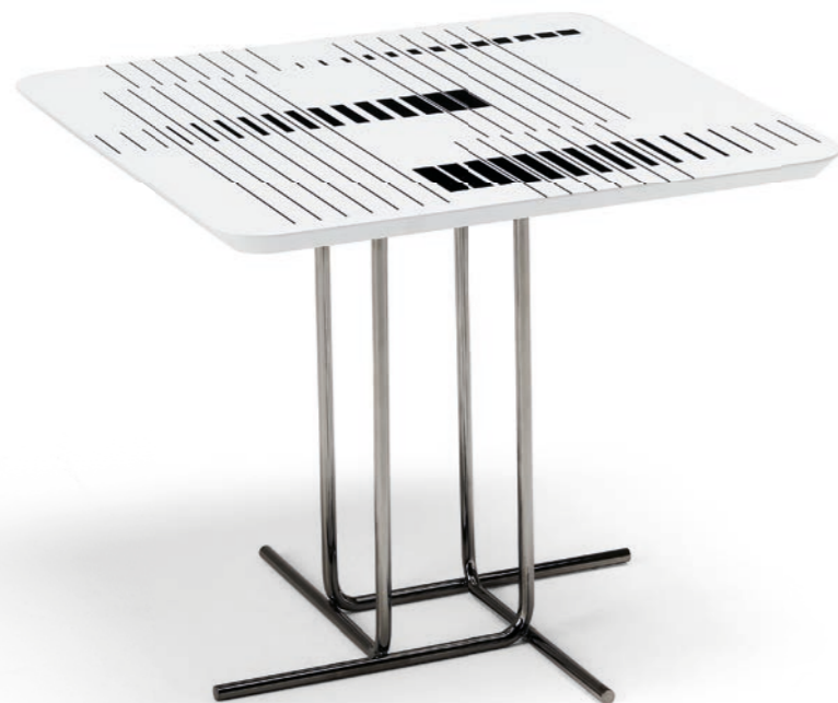
Small table • Alibi : black nickel base.

Una connessione chiara e in continuità stilistico-progettuale con Eclipse e Odissey porta Alibi al mantra del design di Arketipo. Quale? La cura di ogni minimo dettaglio. In primis il top, una finitura in resina che esalta uno stile unico ed un motivo geometrico che rende questo tavolino ancora più originale ogni volta che lo si guarda. Cos'altro? Un'esclusiva base, un'ode alla geometria e alla linearità.