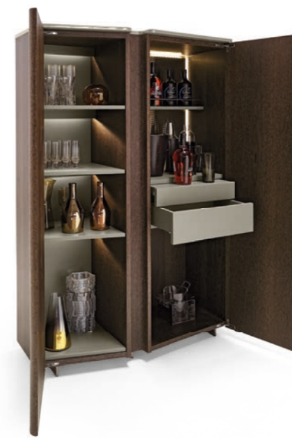
Drinks cabinet • Bolide Bar: in sucupira, top and shelves glossy lacquered RAL 7003, black nickel feet.