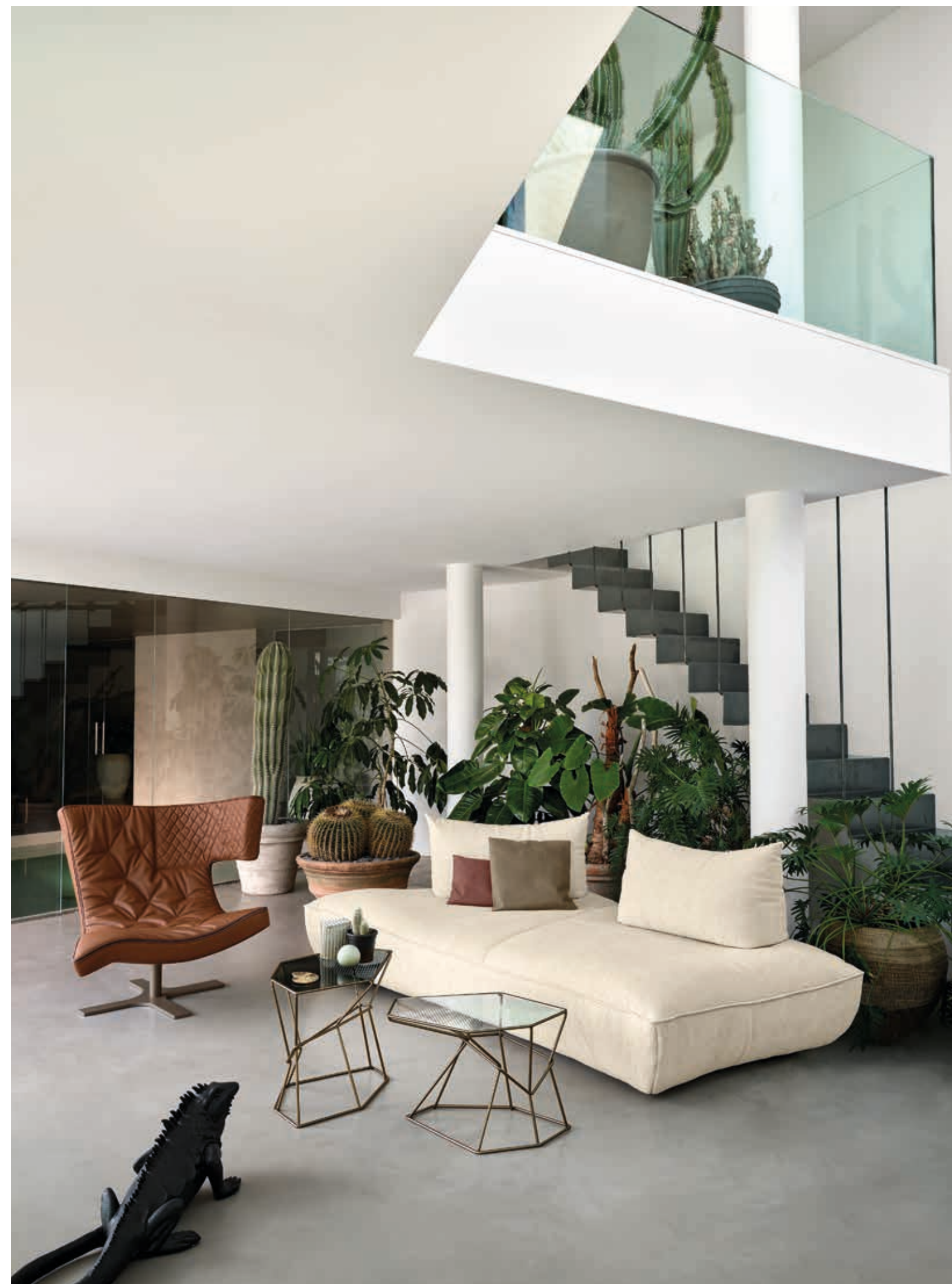
Tavolini • Rebus: struttura titanio.