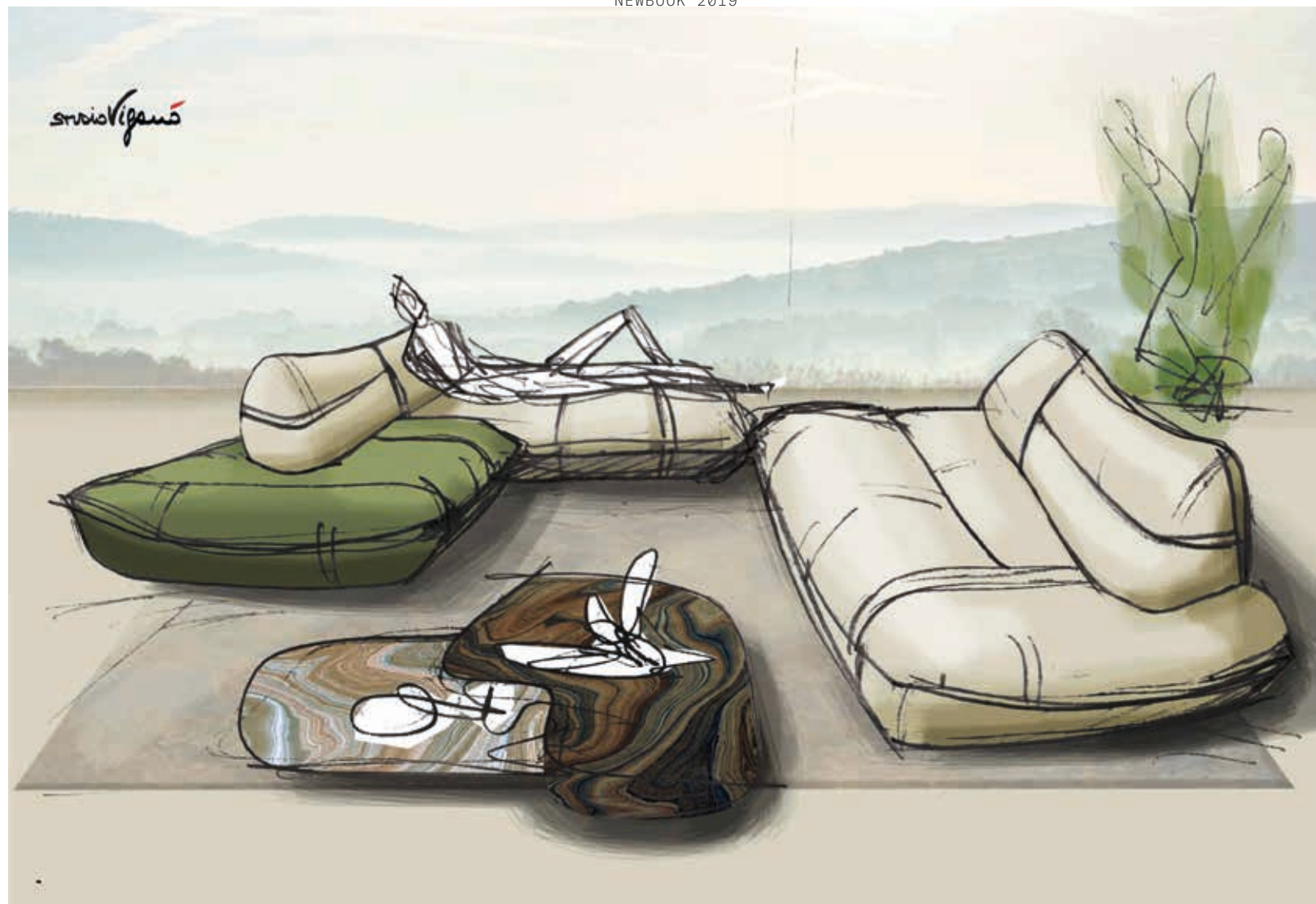
Preliminary studies of Night Fever sofa (2018)