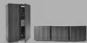
Bolide P 086