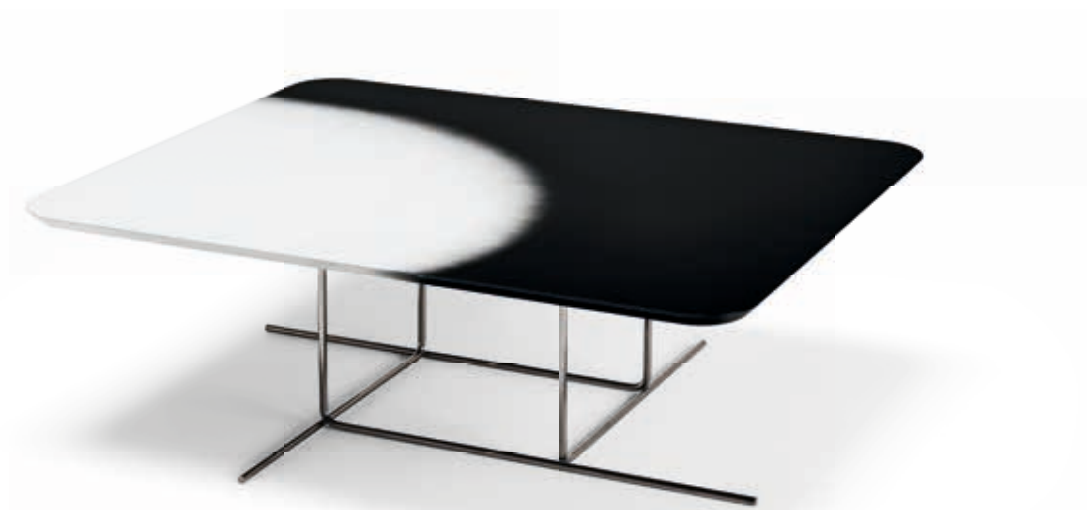
Coffee tables • Eclipse : black nickel base.