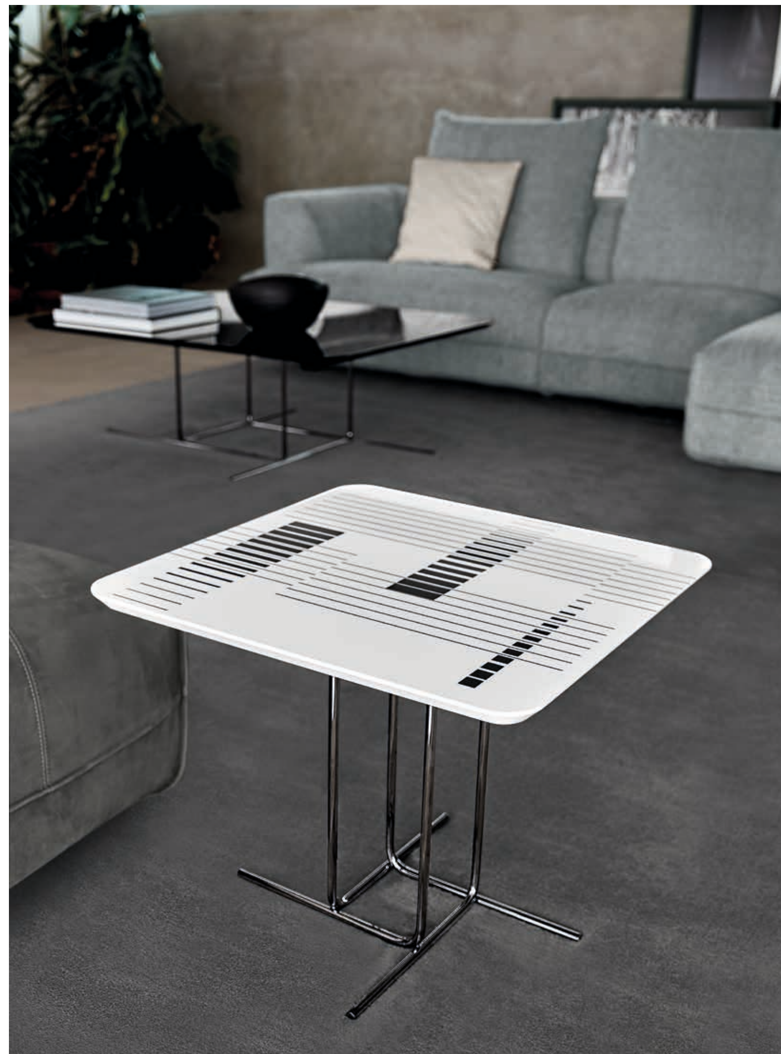
Tavolino • Alibi: base black nickel.