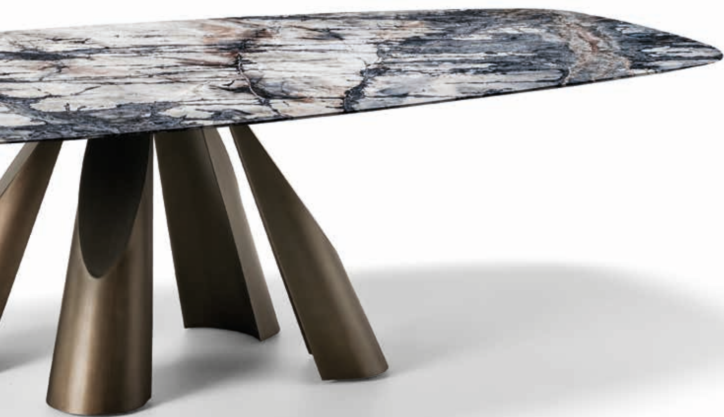
Dining table • Prince: Moon Grey marble top, titanium base. Tavolo • Prince: piano in marmo Moon Grey, base titanio.

Chairs • Athena: in leather Pelle B 3149, titanium base.