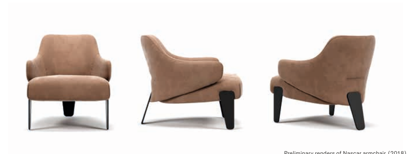
Preliminary renders of Nascar armchair (2018)