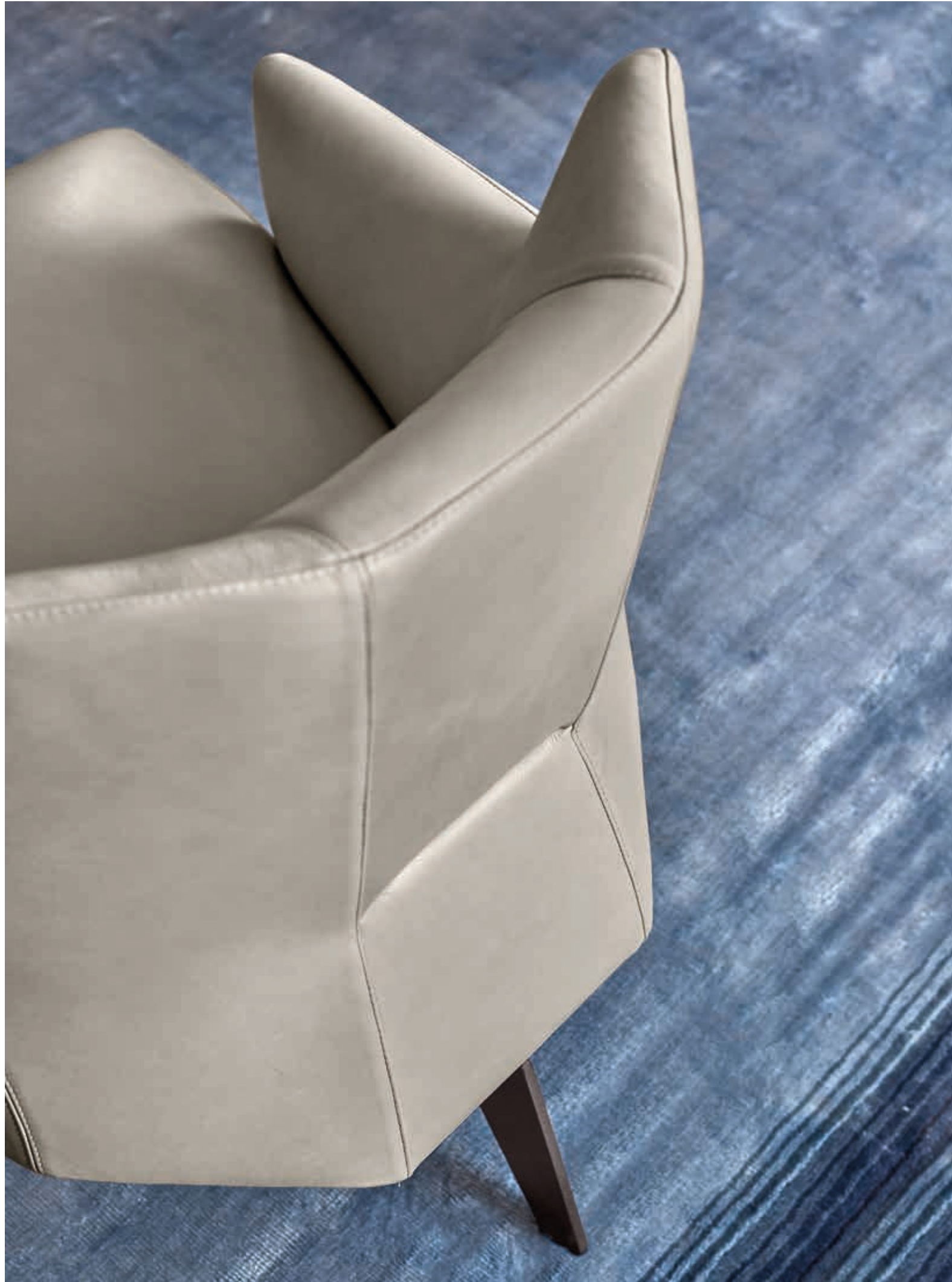
Armchair • NASCAR: in leather Pelle B 3153, micaceous brown feet.