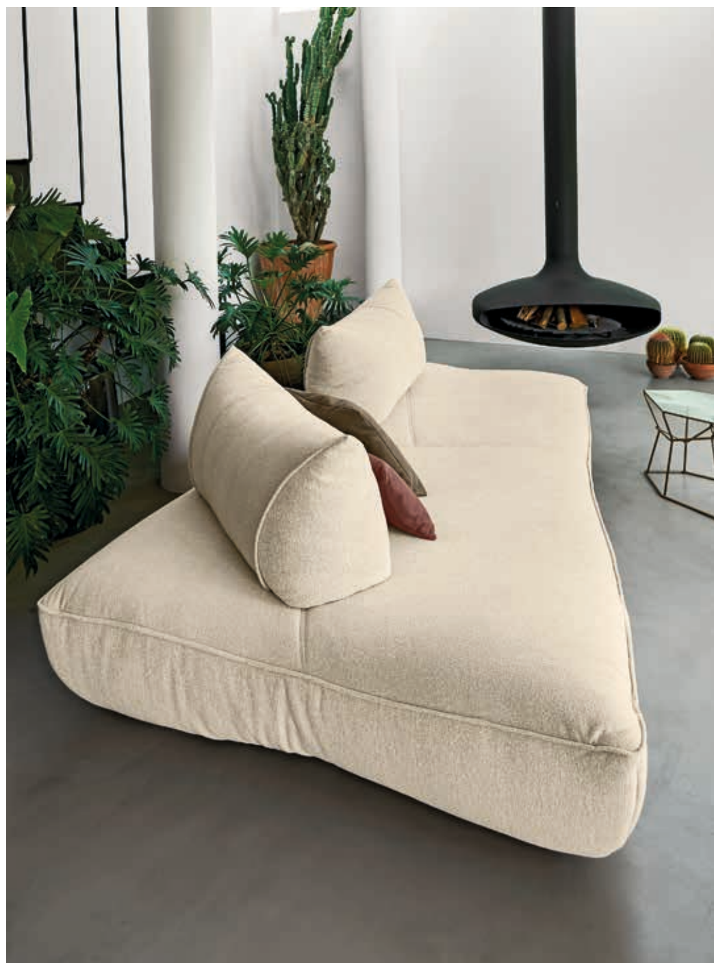
Sofa • Night Fever • seat unit B4.32 + 2 back cushions: in fabric D/4695 collection Dakota.