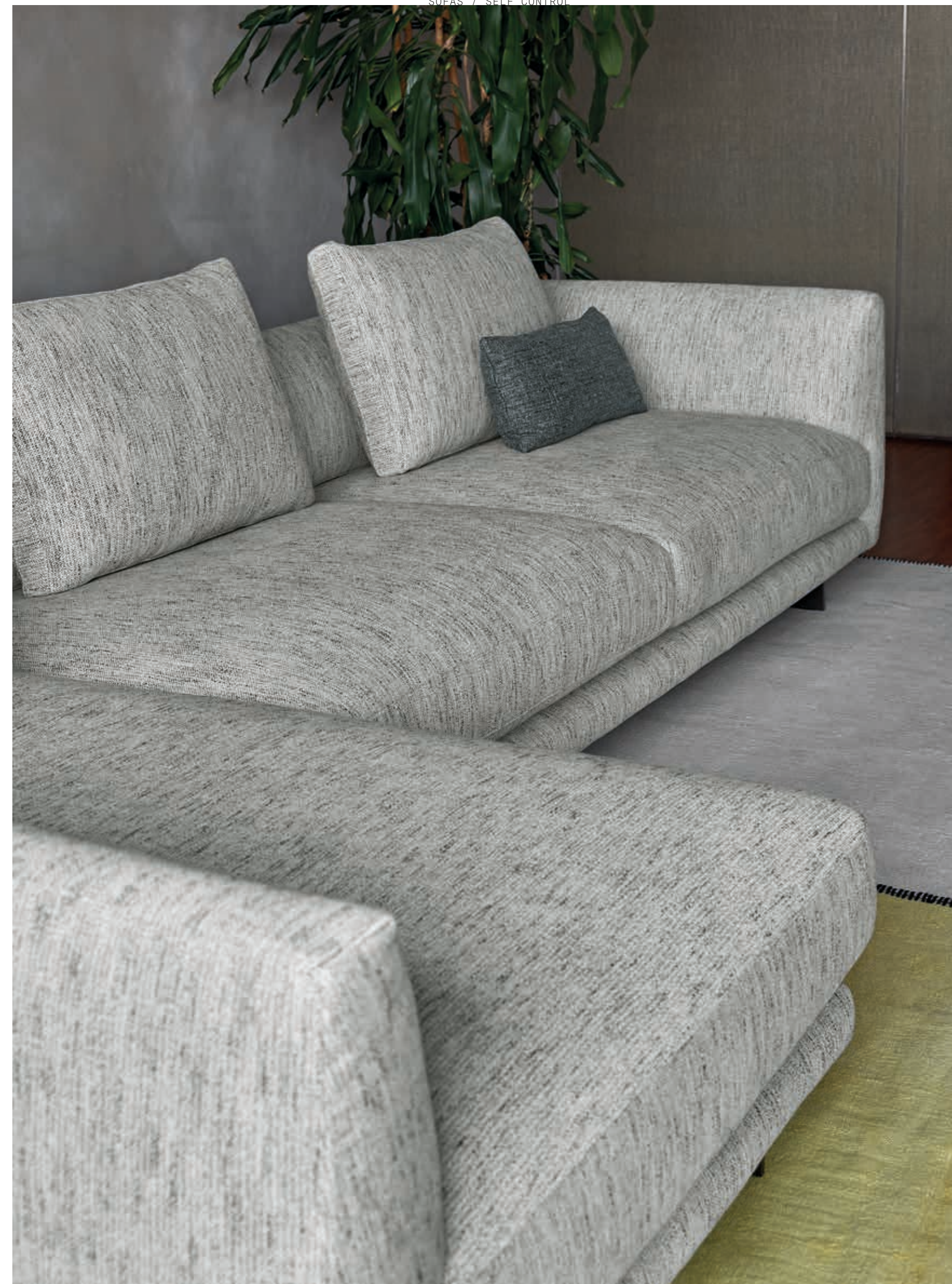
Sofa • Self Control • Composition "E" (opposite): in fabric D/4985 collection Dub, black nickel feet.