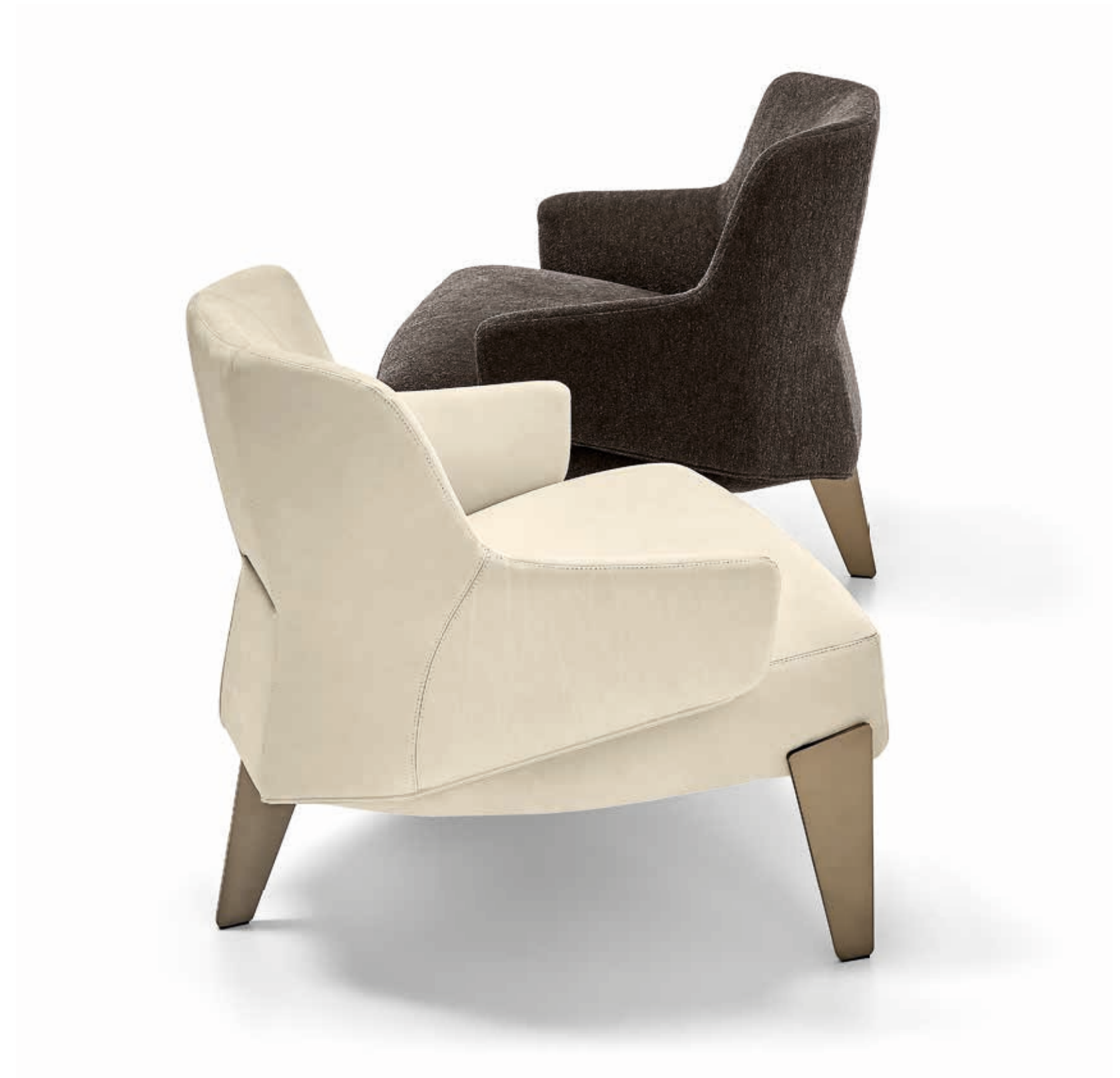
Armchairs • NASCAR: in fabric D/4697 collection Dakota and in leather Pelle B 3110, titanium feet.