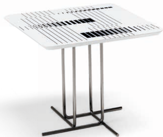
Small table • Alibi: black nickel base.

Una connessione chiara e in continuità stilistico-progettuale con Eclipse e Odyssey porta Alibi al mantra del design di Arketipo. Quale? La cura di ogni minimo dettaglio. In primis il top, una finitura in resina che esalta uno stile unico ed un motivo geometrico che rende questo tavolino ancora più originale ogni volta che lo si guarda. Cos'altro? Un'esclusiva base, un'ode alla geometria e alla linearità.