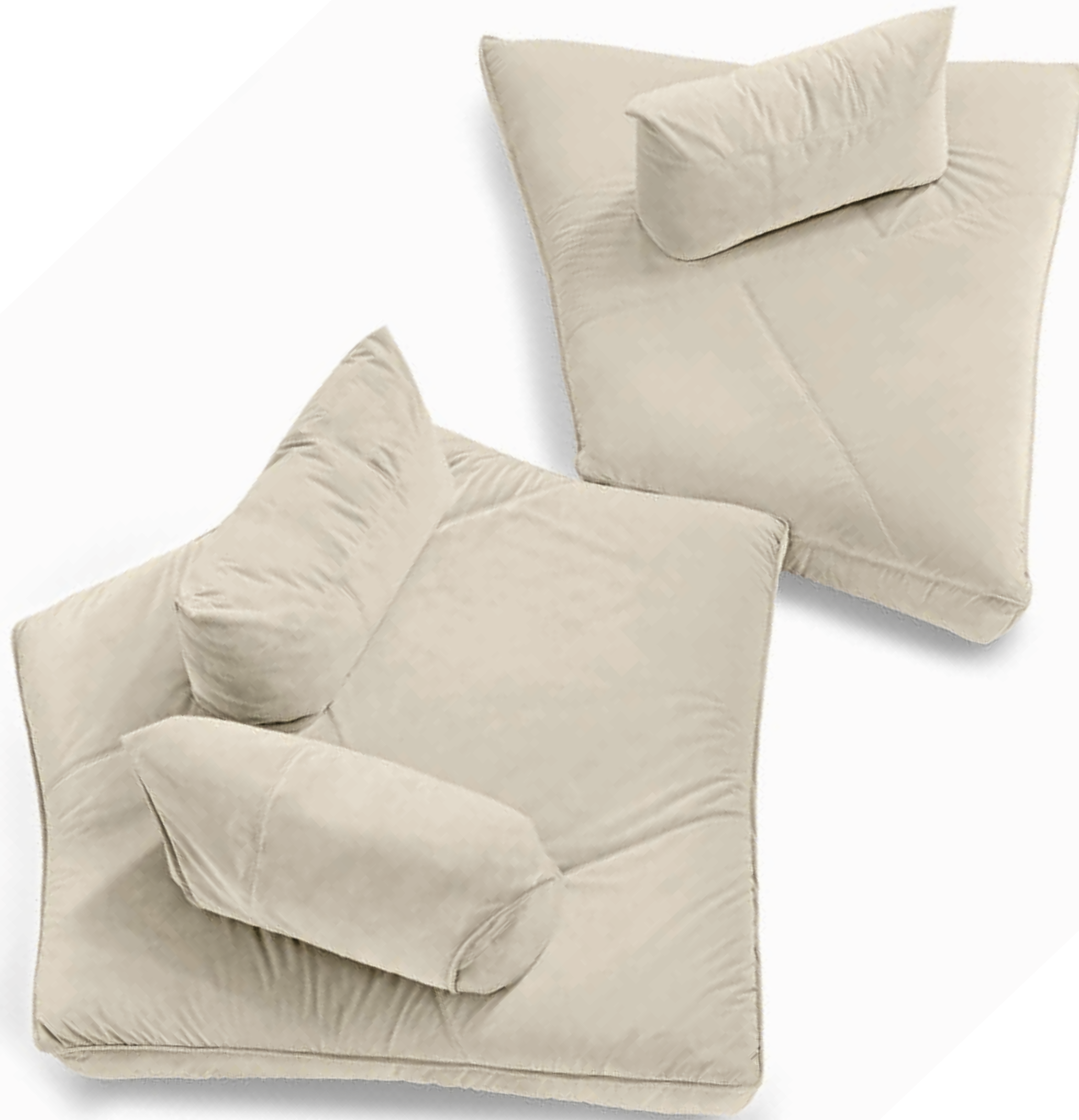
Sofa • Night Fever • Composizione "I" : in fabric E/5566 collection Vellù PL.