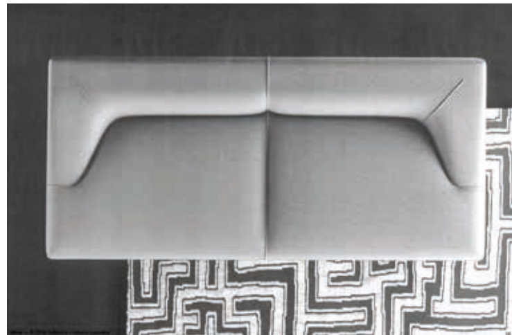
Preliminary renders of Self Control and Starman sofas, (2018)

«Starman and Self Control are about curves.»