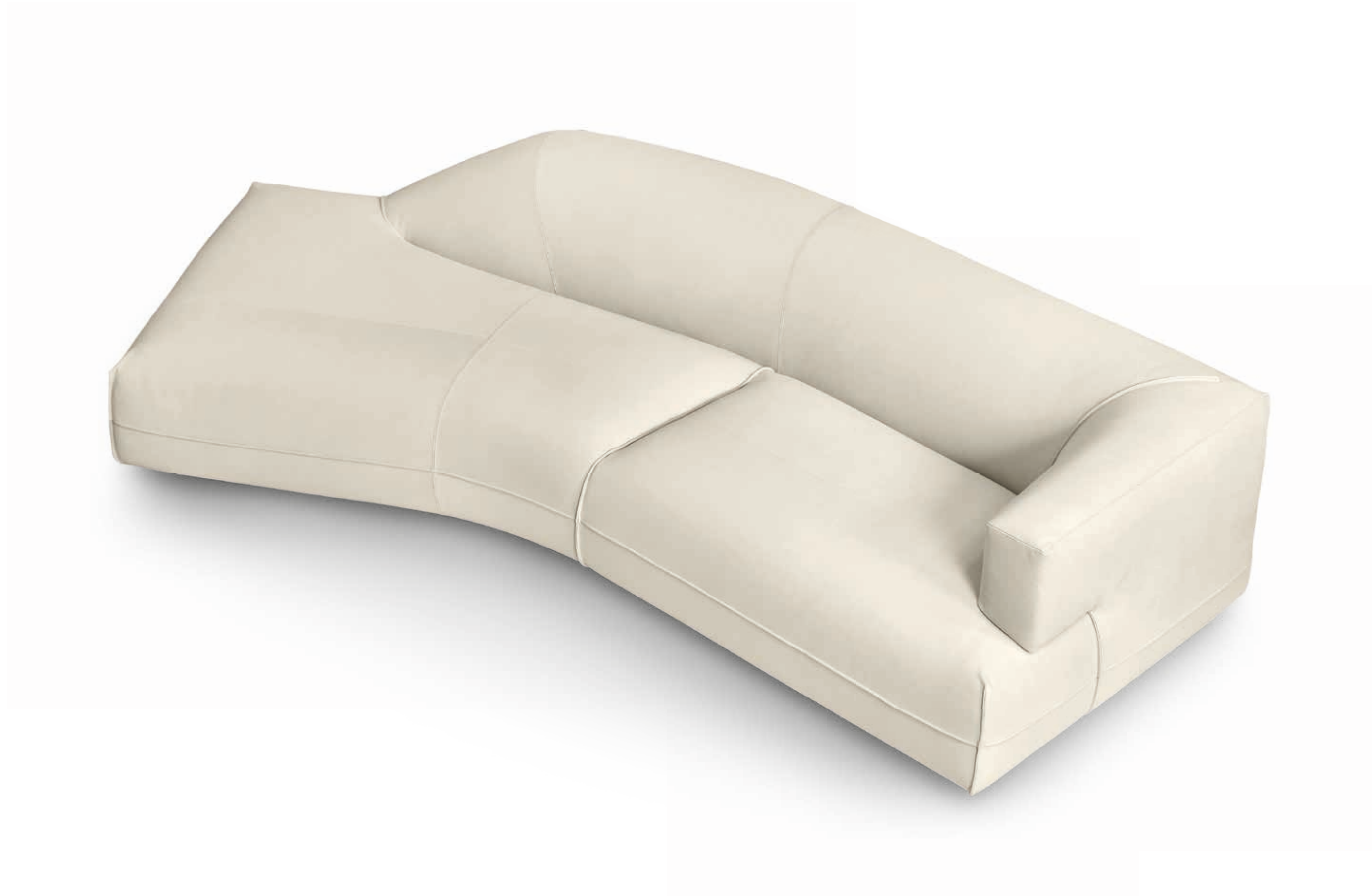
Sofa • Starman • right unit with left pouf and angle 30°: in leather Pelle B 3167.