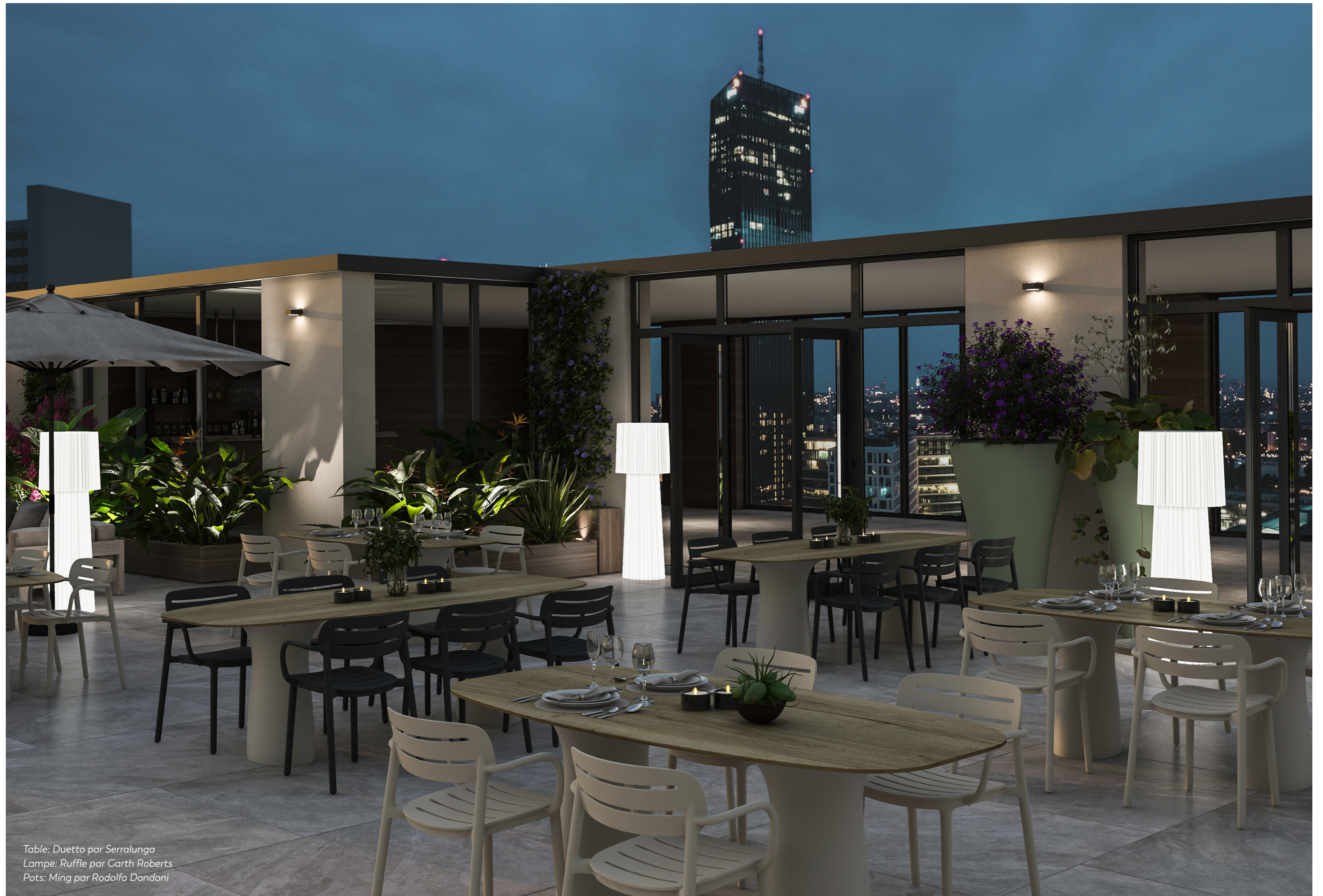
Table: Duetto par Serralunga Lampe: Ruffle par Garth Roberts Pots: Ming par Rodolfo Dondoni