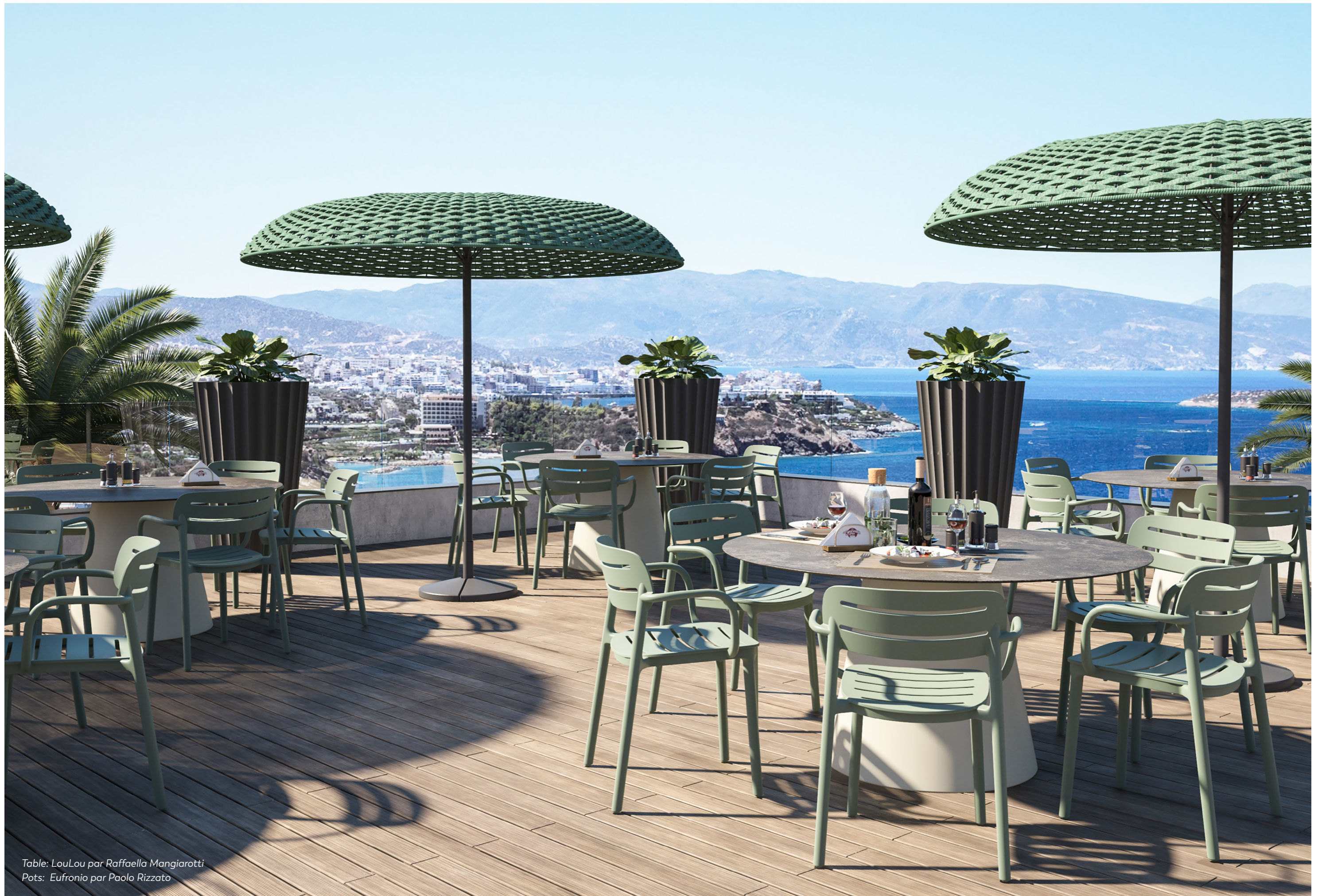
Table: LouLou par Raffaella Mangiarotti Pots: Eufronio par Paolo Rizzato