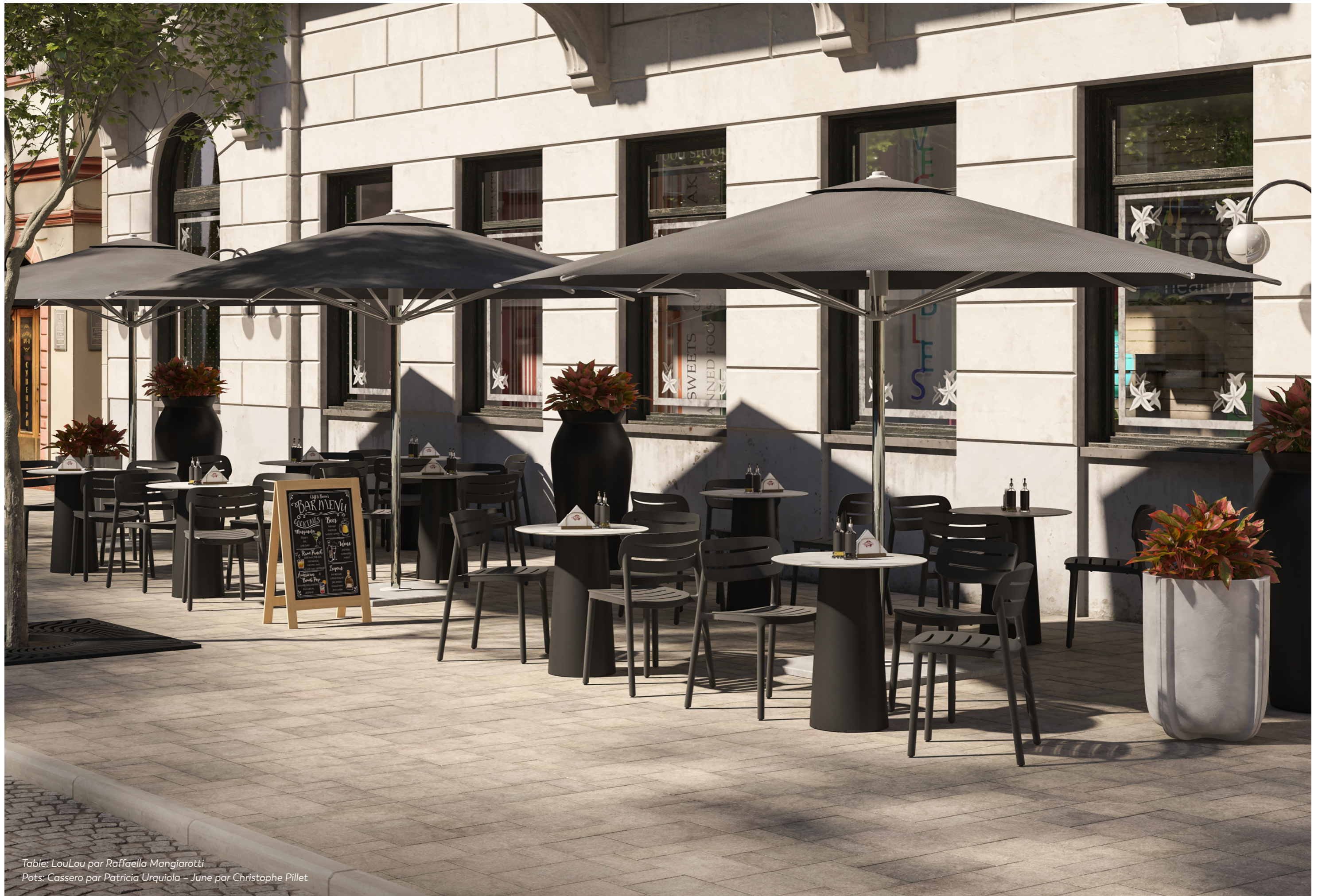
Table: LouLou par Raffaella Mangiarotti Pots: Cassero par Patricia Urquiola - June par Christophe Pillet