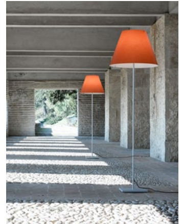
Grande Costanza Open Air